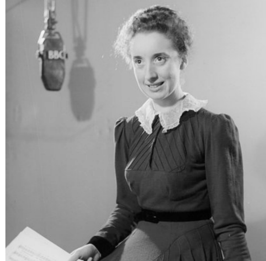
Jeanne Demessieux i radiointervju för BBC 1948

Förutom den obesvarade frågan varför Dupré bröt all kontakt med Demessieux är en intressant frågeställning varför han tidigare ägnat så stort engagemang att forma Demessieux till den virtuosa hon