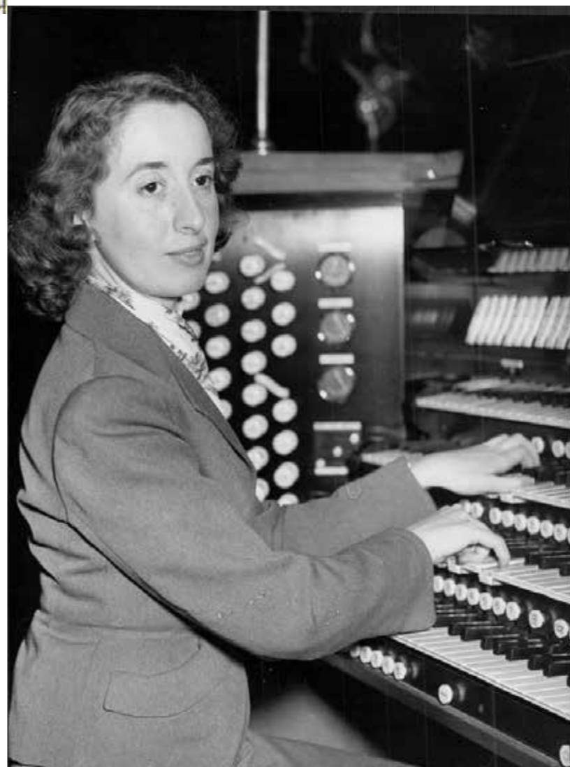
Jeanne Demessieux vid orgeln i McEwan Hall, University of Edinburgh 1954

Demessieux spelade allting utantill och hade en repertoar på över 2 500 kompositioner, inklusive samt-