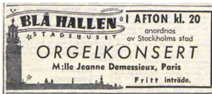
Annons i Svenska Dagbladet inför Demessieux konsert i Stockholms stadshus den 27 mars 1952. Ur Svenska Dagbladets historiska sidarkiv.

Genom Duprés PR-kontakter spreds ryktet om debutkonserter och den unga stjärnan. Detta medförde att Demessieux snabbt fick en lång rad inbjudningar att hålla konserter i hela Europa. Vid många av dessa tillfällen var hon den första kvinnan någonsin att spela i de katedraler, kyrkor och konsertsalar där hon uppträdde. Inom loppet av fyra år kom hon att ge 200 konserter i praktiskt taget alla större europeiska städer. Hon gästade för övrigt Sverige 1952 och gav då konserter i Göteborgs konserthus och Stockholms stadshus.