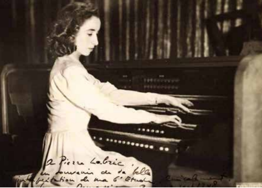
Jeanne Demessieux vid orgeln i Salle Pleyel 1946

hon skulle vänta med sin formella debut till dess hon byggt upp en extrem teknik och likaledes en ofantlig repertoarmängd. Därmed fortsatte hennes vistelse hemma hos Dupré under ytterligare ett antal år. Han formade henne efter sina musikaliska ideal och planerade in en serie debutkonserter för henne som saknat motstycke i hela orgelhistorien.