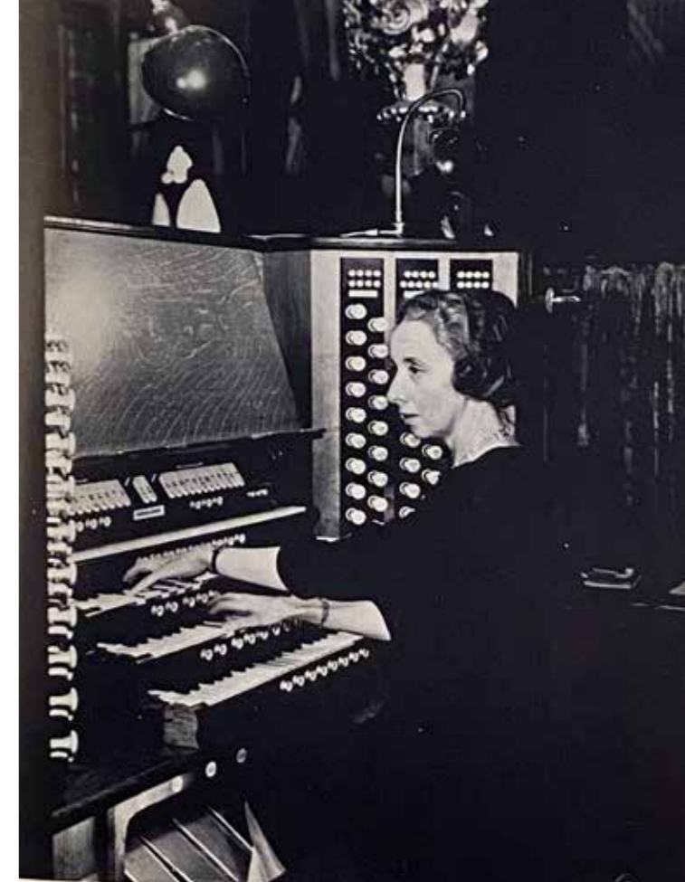
Jeanne Demessieux vid orgeln i Westminster Abbey i London 1967.

ibland hade svårt att hävda sig i sitt eget hemland. Mot slutet av 1950-talet kom emellertid nya modesvängningar och nya ideal. Mekaniska orglar började så småningom byggas i Paris, en ny generation organister började etablera sig som bland annat gjorde omfattande inspelningar med exempelvis tysk och fransk barockmusik. Nya intresseområden bidrog till att fokus hamnade på annat än Demessieux. Även om hon inte hade fallit i glömska hade hon och hennes spelstil under 1960-talet inte samma dignitet som den haft under tidigare årtionden då hon var ett allmänt samtalsämne i hela orgelvärlden.