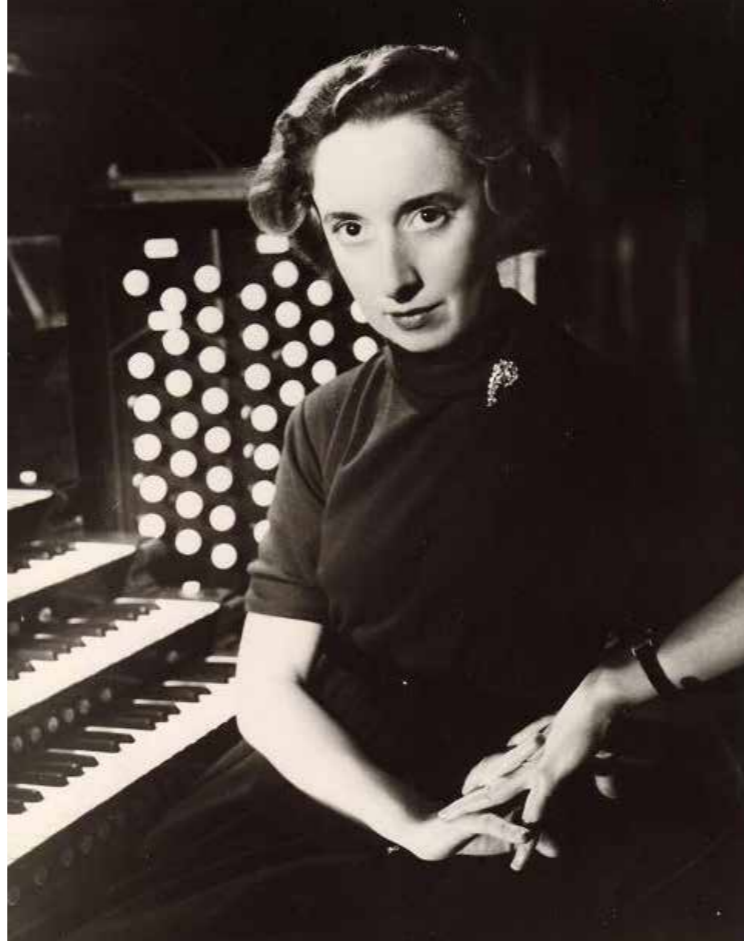
Jeanne Demessieux på sin tredje USA-turné 1958. Här vid orgeln i Cathedral of Saint John the Divine i New York, som inspirerade till hennes mest spelade verk Te Deum .

Demessieux första Amerikaturné ägde rum 1953 och den var mycket framgångsrik. Hon återvände 1955 och 1958. Turnéerna gick från kust till kust och vid varje konserttillfälle lär konsertsalarna och kyrkorna ha varit fullsatta. Hennes popularitet har jämförts med den amerikanske organisten Vigil Fox, trots att Demessieux representerade en helt annan stilriktning.