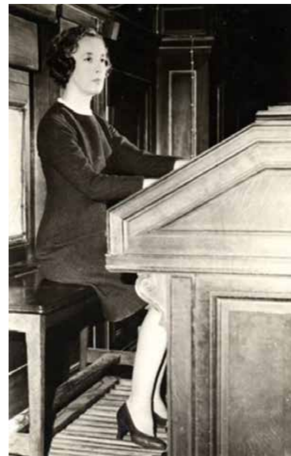
Jeanne Demessieux, Madeleinekyrkan i Paris 1967

Demessieux karriär hade sin höjdpunkt under 1940-talets andra hälft samt under 1950-talet. Detta till trots att brytningen med Dupré gjorde att hon